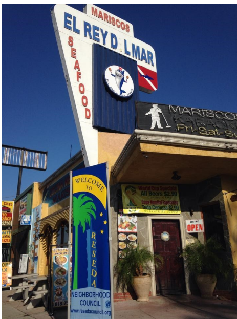
Algunas de las posibles mejoras en Sherman Way podría incluir cafés, parklets, infraestructura para bicicletas, mejoras de alumbrado público, jardinería, señalización, y más.

En un próximo evento contará con la Oficina del Censo, una vez más la realización de un taller en Reseda en Everest College que ha hecho generosamente su laboratorio de computación disponibles para el evento. Habrá 24 estaciones de computadoras disponibles, pero si usted trae su ordenador portátil, usted será capaz de seguir adelante y posiblemente marcar las áreas de interés para su uso futuro.