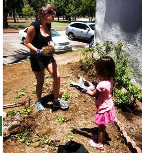
Un agradecimiento especial a un grupo de voluntarios que se unieron para hacer jardinería y paisajismo mejoras en ONEgeneration Senior Center adyacente a Reseda Park el Victory.

7/25 The Family (2013) (112 min) Robert De Niro, Michelle Pfeiffer, Tommy Lee Jones